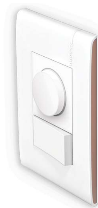
dimmer rotativo universal en placa blanca de 3 módulos con perfiles laterales color Moka.