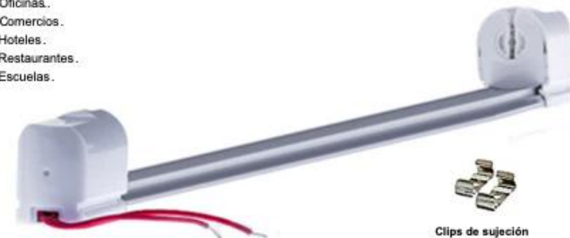
Clips de sujeción