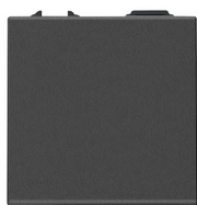
09001.2.CM - Interruptor 1P 16AX 2M carbon matt