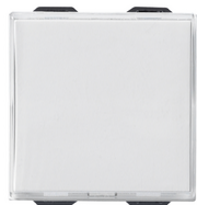
09050 - Pulsador 1P NO 10A con plaquita blanco