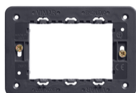
21613 - Soporte 3M con tornillos